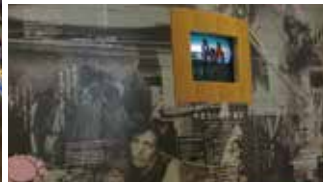
「いま、せかいで何が」のコーナーのひとつ、「なくならない貧困」。