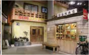
1960年代、ベトナム戦争の頃の基地の町並み、Aサインバーや当時の商店(マチャグラー)が再現されている。