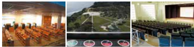
■情報ライブラリー（1階） ■展望室 ■平和祈念ホール（1階） 230名程度収容できます。

数多くの図書・雑誌を閲覧できるほか、AVブースでは戦争体験者の証言や平和に関するビデオ等もご覧になれます。また、中央の検索コーナーでは、パソコンの簡単な操作で資料館に収蔵されている多くの収蔵品や図書文献の情報を閲覧することができます。