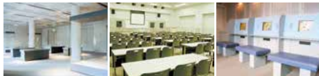
■企画展示室（1階） 255㎡の広さで沖縄戦と平和に関連した企画展示を行っています。 ■会議室（2階） 教室形式で、100名程度収容できます。 ■クイズコーナー（1階） 利用者がモニター画面に触れ、沖縄に関するさまざまなクイズに答えます。