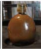
沖縄戦当時の水が入った水筒