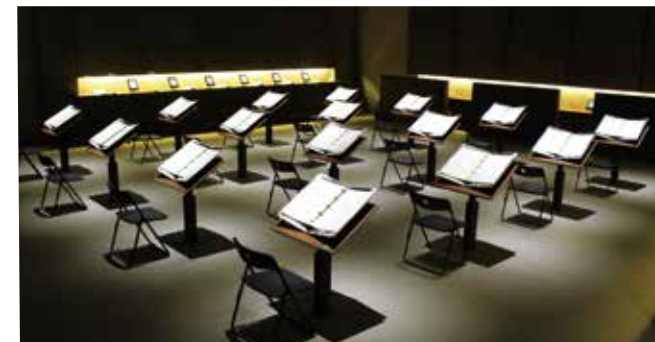
沖縄各地、疎開先、移民した国々での戦争体験証言の部屋。証言映像もご覧になれます。

沖縄戦の実相を語るとき、物的資料になるものは非常に少ない。無念の思いで死んでいった人々を代弁できるものは、戦場で体験した住民の証言しかない。忘まわしい記憶に心を閉ざした人々の重い口から、後世に伝えようと語り継がれる証言の数々は、歴史の真実そのものである。