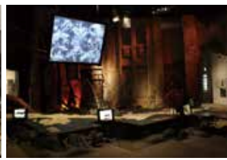
大型スクリーンに映し出される沖縄戦の様子