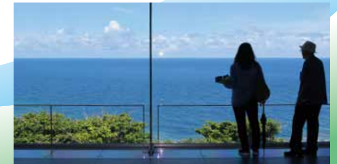
太平洋の大海原と打ち寄せる白波、青く広がる空の美しい景観にいやされる。