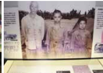
沖縄で捕虜となった防衛隊員と義勇隊員