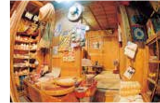
商店(マチャグラー)の内部

沖縄の戦後は収容所から始まった。その後、米・ソを軸とした冷戦構造の中で軍事基地として強化されていく沖縄。土地を奪われ、さまざまな抑圧を受けてきた住民の怒りは、島ぐるみの土地闘争や復帰運動へと広がっていく。東西冷戦が終わった今もなお、世界各地にくりひろげられる民衆の悲劇。沖縄の教訓は、「平和の要石」を通して世界へ発信される。