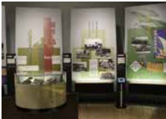
琉球処分から沖縄戦直前まで時系列に沿って展示

明治政府は、琉球王府に対して武力を背景にした「琉球処分」を断行した。そこで、沖縄県は皇民化政策によって急速に日本化を進めた。一方、近代化を急ぐ日本は、富国強兵策により軍備を拡張し、近隣諸国への侵出を企てた。満州事変、日中戦争、アジア・太平洋戦争へと拡大し、沖縄は、15年戦争の最後の決戦場となった。