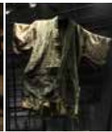
沖縄戦当時の住民の着物