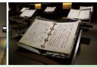
戦争体験の証言 145名(155件)の証言