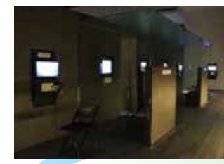
証言映像ブース 約1,000件の証言映像 (一部英語字幕対応)