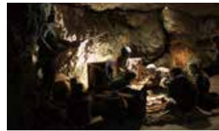
ガマの中に避難している住民、子どもの泣き声もれないように口を押さえる母親、そして威嚇する日本兵

沖縄守備軍は首里決戦を避けて南部へ撤退し、出血持久作戦をとった。その後、米軍の強力な掃討戦により追いつめられ、軍民入り乱れた悲惨な戦場と化した。壕の中では、日本兵による住民虐殺や、強制による集団死、餓死があり、外では米軍による砲爆撃、火炎放射器などによる殺戮があってまさに阿鼻叫喚の地獄絵の世界であった。