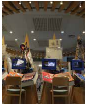
世界はひとつ! 18人の子どもたちが来館者を笑顔で迎えてくれる。

子ども・プロセス展示室は、大きく三つにわかれている。「ぬちどう宝・せかいの子どもたち!」は、さまざまな国の18人の子どもたちに学校のように、お友だち、遊びのことなどを聞くことができる。「いま、せかいで何が」は、なくならない戦争・紛争、いじめなどの人権問題、むしばまれる地球環境など、世界的な、あるいは、身近な問題を取り上げ、その原因、どうしたら解決できるのかなどを考えてもらうコーナーである。「わらびな(庭)」は、展示物にふれながら、遊びを通して共通性を発見し、違いを認め合うきっかけづくりができる。親子や友人同士で平和について語り合える場がここにある。