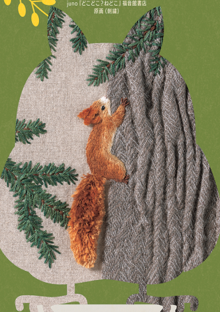
juno「どこどこふねどこ」福島県書店 原典(刺繍)