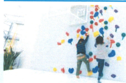
⑧ 芝生広場・展示庭園