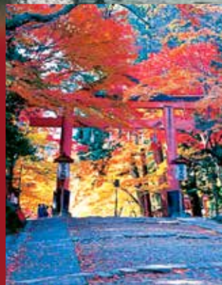
門前町坂本の石積

日吉大社 全国の日吉神社・日枝神社の総本宮。独特な形をした“山王鳥居”は別名“惣合神門”と云い、東西に向かい全国の神々を拝する場所でもある。鳥居の朱、もみじの紅と清流の大宮川、澄み渡る秋空と見事に調和した境内です。