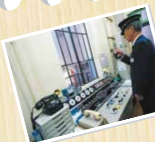
ケーブル延暦寺の駅にある運転室で巻上機を操作しています。

「ケーブル坂本駅」大正14年に建設された洋風木造二階建の駅舎。当時モダンな洋風建築として人気を博したといえます。国の登録有形文化財に登録されました。