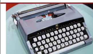
ブラザー初のタイプライター