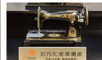
ブラザー初の家庭用ミシン