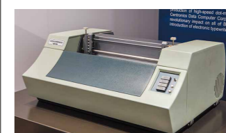
ブラザー初のプリンター