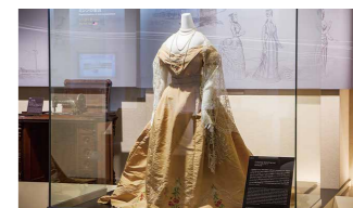
19世紀後半のアンティークドレス