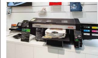
ガーメントプリンター