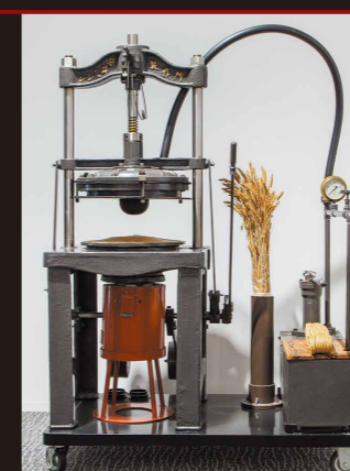
麦わら帽子製作用水圧機 ブラザー初の製品

ミシンの国産化に始まり、編機・家電・タイプライターなど多角化の時代を経て、情報通信機器や産業機器なども世に送り出してきたブラザーの代表的な製品を紹介し、時代を超えて脈々と受け継がれてきたブラザーのモノ創りのDNAを知っていただきます。