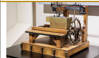
世界最初のミシン(レプリカ)