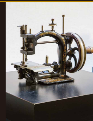
麦わら帽子製造用環縫ミシン 最初のブラザーブランド製品

世界最初のミシン(複製)を始め世界各国から収集したアンティークミシンやブラザーの代表的なミシンを幅広く展示しています。機構別展示などでミシンの構造や布を縫うメカニズムについても学んでいただくことができます。