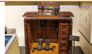
シンガー社の代表的なミシン