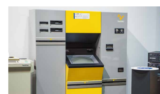
世界初のパソコンソフト自販機