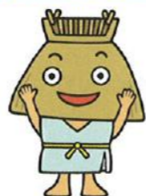
情報映像コーナー