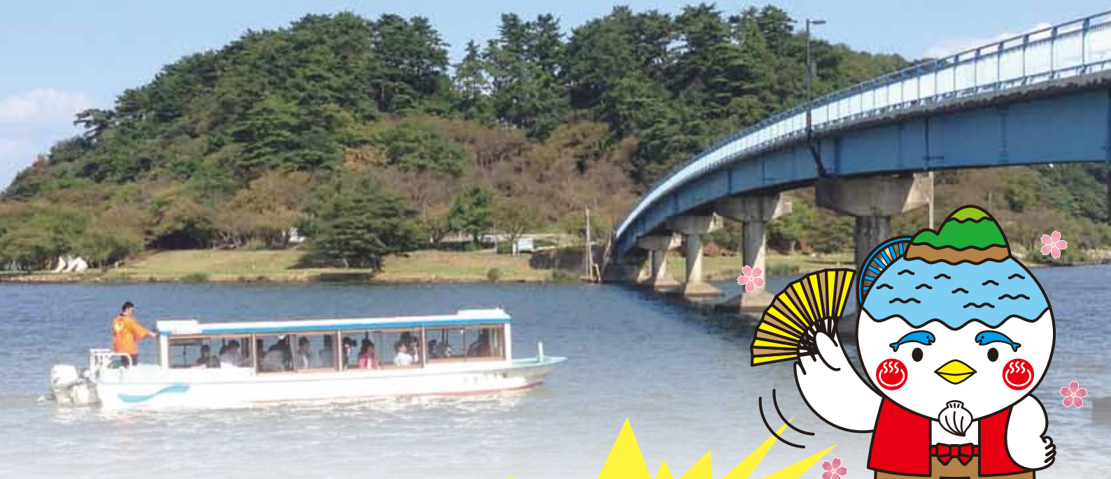
湖山池遊覧船語り部