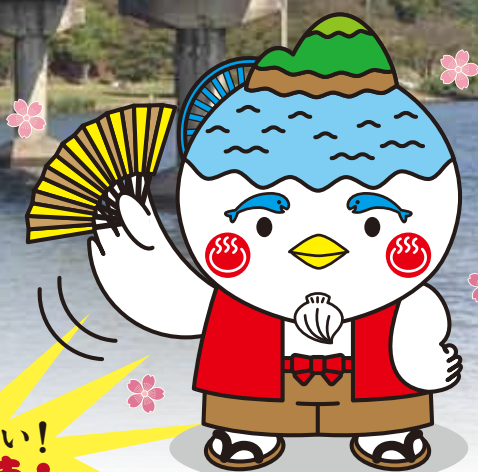
▲湖山池マスコットキャラクター 湖池(こいけ)ちゃん