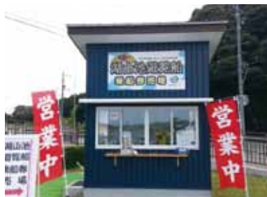
遊覧船乗船券売場▲