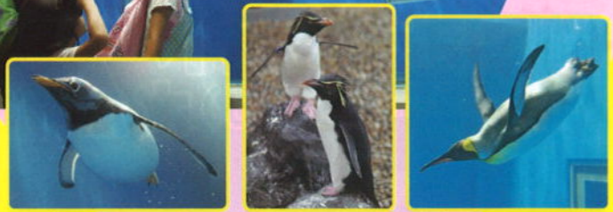
シエンソーペンギン イフトヒペンギン オウサマペンギン

亜南極圏にすむ3種類 (シエンソー・イフトヒ・オウサマ)の ペンギンたちが、空をとびように 自由に泳ぎ回ります。 大人も子どもも大興奮!!